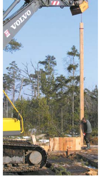
Einbau der Spundwände

Ein wesentliches Ziel dieser Maßnahmen ist es, dieses Gebiet wieder zu vernässen. Denn seit Beginn des 19. Jahrhunderts wurde es systematisch durch Gräben entwässert. Dadurch konnte in Teilbereichen bis 1960 Torf abgebaut werden. Außerdem wurden Kanäle, die von italienischen Arbeitern in den 1870er Jahren gegraben wurden, mit speziellen Beförderungsbooten (Nachen) befahren, um wertvolle Streue abzutransportieren.