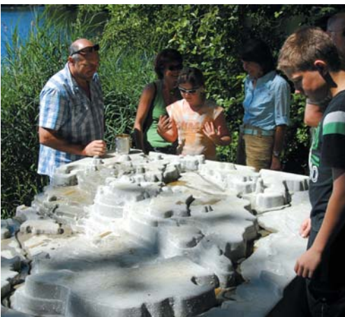
Geländemodell am Häcklerweiher

Der SCHAUmal-Weg führt rund um die Blitzenreuter Seenlandschaft und bietet grandiose Blicke in die wertvolle Naturlandschaft. Ein Weg zum Sehen, Hören, Fühlen, Riechen und Genießen. Bei einer Länge von ca. 8,1 km, muss schon ein halber Tag eingeplant werden.