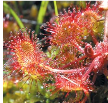
Sonnentau am Bohlenweg