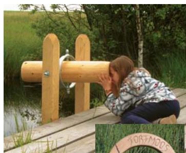
"Sehrohr" und "Holzlupe" auf dem Bohlenweg

Frage: Wie kommt das Weiherwasser zur Schussen? Einfach Wasser ins Modell gießen und genau schauen, wo es hinfließt.