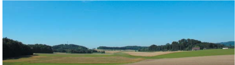
Blick vom "Panorama-Stuhl"