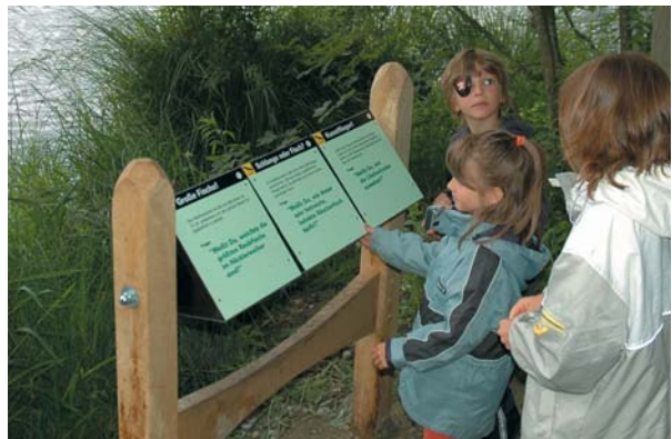
Frage- und Antwortspiel "Fische"

Zurück zum Ausgangspunkt Häcklerweiher geht es dann über einen breiten Waldweg.