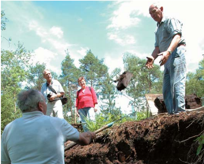
Schau-Torfstechen am DENKmal-Weg

Die Kosten teilten sich die EU (60 % aus EU LIFE-Programm), das Land Baden-Württemberg (Forstverwaltung, Naturschutzverwaltung, Wasserwirtschaftsverwaltung), die Gemeinden Fronreute und Wolpertswende, der Landkreis Ravensburg, die Stiftung Naturschutzfonds beim Ministerium Ländlicher Raum und der Projektträger PRO REGIO OBERSCHWABEN GmbH selbst.