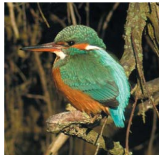
Eisvogel am Schreckensee (SCHAUmal-Weg)

**Anzahl Arten Rote Listen und FFH-Anhänge