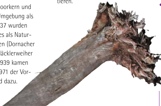
3000 Jahre alte Moorkiefer, gefunden beim Bau der Spundwände