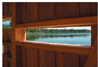
Beobachtungskanzel am Schreckensee

Eine 16 Beobachtungskanzel mit Sehschlitzen bietet einen weiten Blick auf die Wasserfläche. Mit etwas Glück kann man seltene Vogelarten