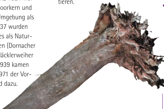
3000 Jahre alte Moorkiefer, gefunden beim Bau der Spundwände