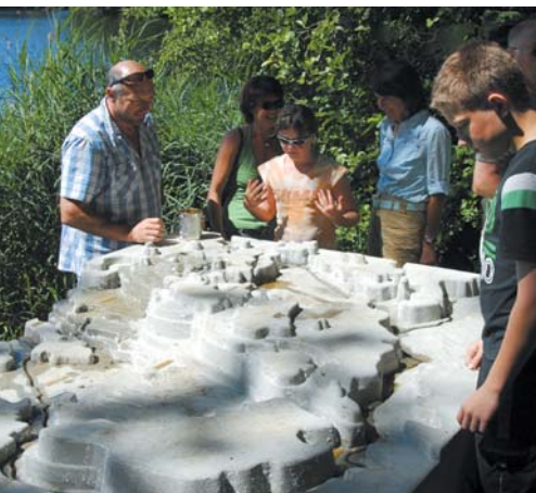
Geländemodell am Häcklerweiher

Der SCHAUmal-Weg führt rund um die Blitzenreuter Seenlandschaft und bietet grandiose Blicke in die wertvolle Naturlandschaft. Ein Weg zum Sehen, Hören, Fühlen, Riechen und Genießen. Bei einer Länge von ca. 8,1 km, muss schon ein halber Tag eingeplant werden.