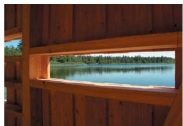
Beobachtungskanzel am Schreckensee

Eine 16 Beobachtungskanzel mit Sehschlitzen bietet einen weiten Blick auf die Wasserfläche. Mit etwas Glück kann man seltene Vogelarten