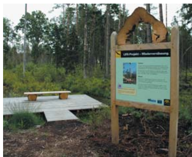
Plattform im Wolpertswender Torfstich

als lustige Symbolfigur, begleitet die Besucher von Station zu Station und gibt dabei wertvolle Hinweise, Anregungen und Spielanleitungen.