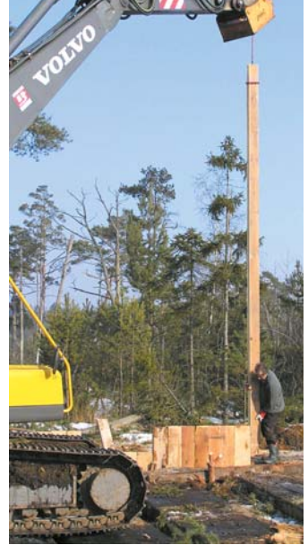
Einbau der Spundwände

Ein wesentliches Ziel dieser Maßnahmen ist es, dieses Gebiet wieder zu vernässen. Denn seit Beginn des 19. Jahrhunderts wurde es systematisch durch Gräben entwässert. Dadurch konnte in Teilbereichen bis 1960 Torf abgebaut werden. Außerdem wurden Kanäle, die von italienischen Arbeitern in den 1870er Jahren gegraben wurden, mit speziellen Beförderungsbooten (Nachen) befahren, um wertvolle Streue abzutransportieren.