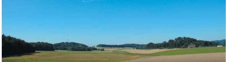
Blick vom "Panorama-Stuhl"